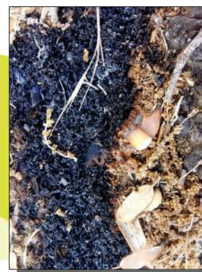
Détail de mégot à l'origine de l'incendie