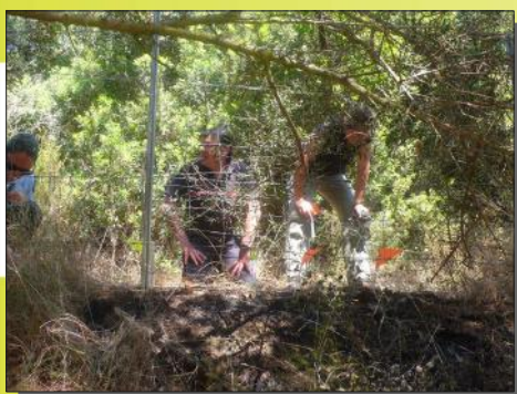
Cellule technique d'investigation en action sur le terrain

Quelques rapports des CTIIF départementales ont permis également de consolider certaines procédures judiciaires déclenchées contre des auteurs présumés d'incendies.