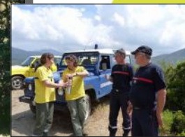
Cellules inter-services comprenant forestiers (ONF ou DDTM), pompiers, police ou gendarmerie

Ces dernières années, la connaissance des causes s'est nettement améliorée. En effet, même si le taux de renseignement sur Prométhée est encore faible, d'environ 50 % sur l'ensemble de la Corse (données 2010-2016), l'amélioration qualitative de l'information est importante.