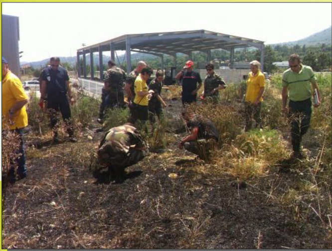
Formation en 2015 : exercice pratique

Dans le cadre des CTIIF, six sessions de formation se sont tenues en Corse pour garantir le maintien des compétences malgré les mutations de personnels propres à l'administration.