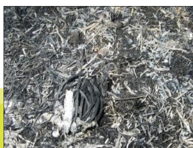
Dispositif de mise à feu