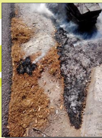
Identification du point d'éclosion